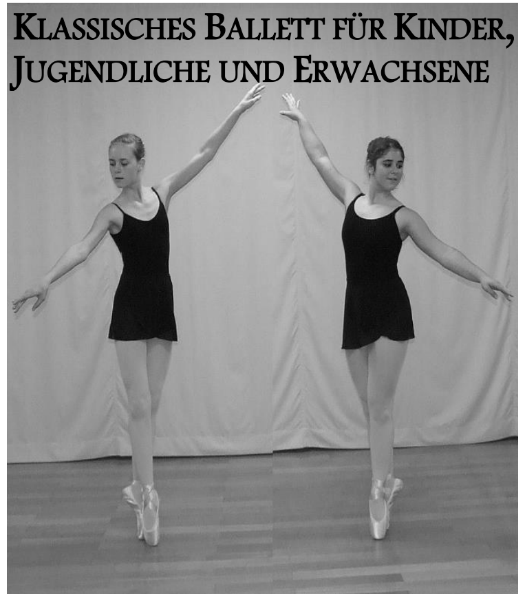
KLASSISCHES BALLETT FÜR KINDER, JUGENDLICHE UND ERWACHSENE